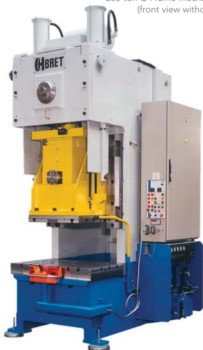
200-ton C-Frame mechanical press (front view without guards).