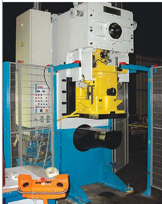
Presse à bigorne de 100 tonnes (réalisation spéciale sur la base d'une PCK 10 standard).